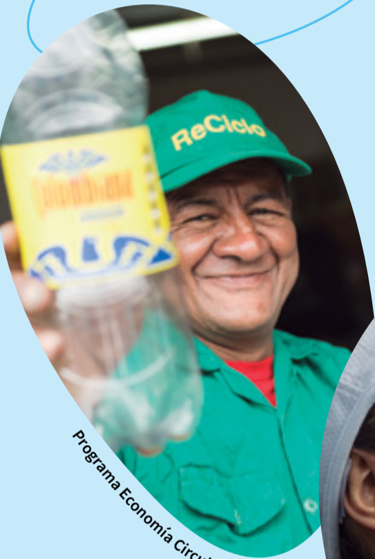
Programa Economía Circular