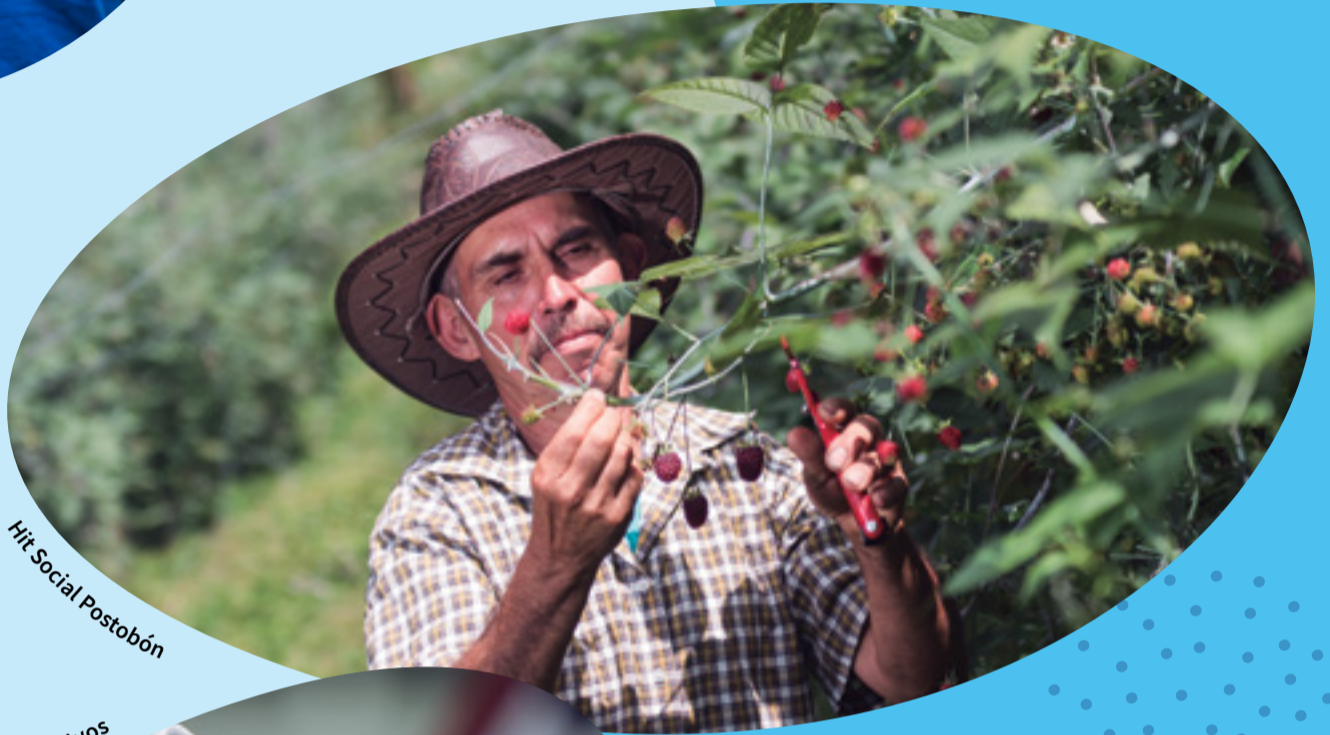
Hit Social Postobón